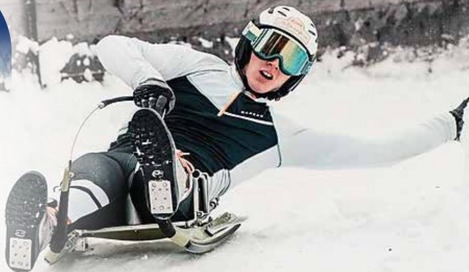
Sebastian Feldhammer/SV St. Sebastian @m.jennewein